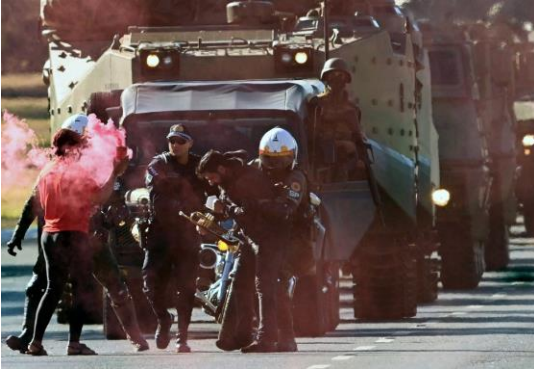
Praça dos Três Poderes, Brasília (10/08/2021)

https://g1.globo.com/df/distrito-federal/noticia/2021/08/10/defile-de-tanques-homen-conhecido-como-trompetista-e-preso-ao-tentar-impedir-passagem-de-veiculos-militares-em-brasilia-gbm.html