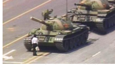
Praça da Paz Celestial, Pequim (05/06/1989)

https://aventurasahistoria.mil.com.br/noticias/reportagem/o-chefe-de-cambede-gista-sobre-identidade-do-jovem-que-desafiou-o-exercito-chines.html